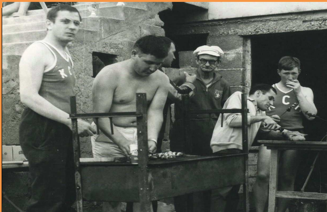
INAUGURATION DU BOAT-HOUSE DE BOUSSE 1ER MAI 1961

Le premier « port d'attache » du K.C.H. au bord de la rivière fut AY-SUR-MOSELLE. Le propriétaire du café AUBERT met à la disposition du club une ancienne grange, au lieu-dit « le Vieux Moulin ». La bâtisse est aménagée et pompeusement baptisée « boat-house ». Ce sont les membres de l'association eux-mêmes qui, entre deux descentes sur la Moselle, troquent leur pagaie pour le rabot ou la truelle. Ils commandent le bois à l'entreprise « BOUR et THIELEN » de METZ, pour confectionner des étagères pour ranger les bateaux. Ce sera ensuite l'installation de cabines de vestiaires, la pose de l'éclairage et, à l'extérieur, la construction d'un solide ponton en bois et d'une passerelle en tubes.